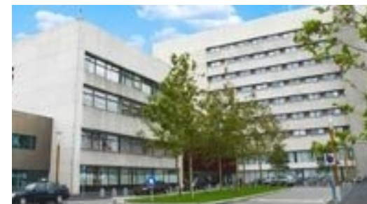
Apotheek SG Locatie Haarlem Zuid