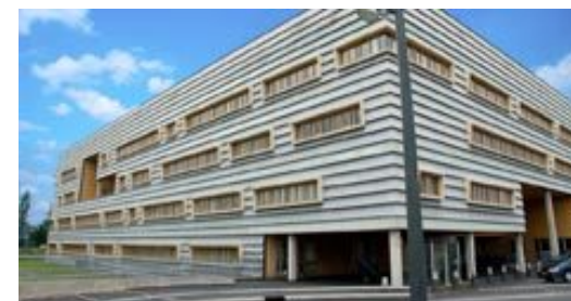
Apotheek SG Locatie Haarlem Noord