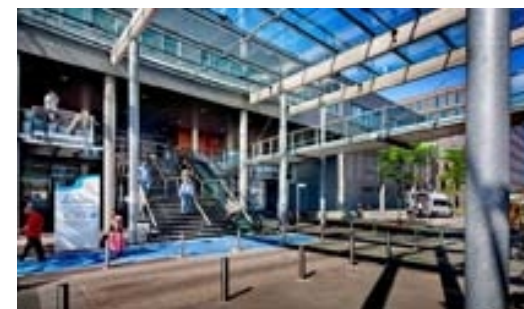
Apotheek SG Locatie Hoofddorp